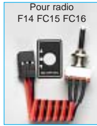
Pour radio F14 FC15 FC16

Voie tout ou rien 2 positions long 001 F1524