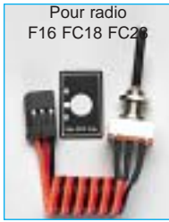
Pour radio F16 FC18 FC28

Voie tout ou rien 3 positions court 001 F1500