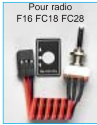
Pour radio F16 FC18 FC28

Voie tout ou rien 3 positions court 001 F1500