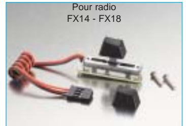
Pour radio FX14 - FX18

Voie linéaire F16 FC18 FC28 001 F1501 Voie linéaire F14 FC15 FC16 001 F1601 Voie linéaire FX14 FX18 Réf: 001 F1587