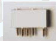
Fiche femelle 5 pôles, 5 pièces réf : 005 78 7033