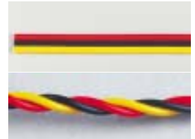
Câble pour rallonge de servo en 3 brins, longueur de 5 m. En nappe réf : 1000 425 MX Torsadé réf : 1000 425 MX/T