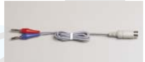
Cordon de charge pour accu d'émission, 1 pièce. Réf : 005 8 6020