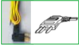
Cordon de servo, 1 pièce Réf : 005 8 5125