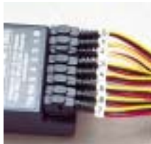
Marquage des câbles de servos. 20 pièces de 0 à 9 réf : 005 8 5059