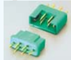
Fiche mâle 6 pôles, 3 pièces. Réf : 005 8 5213 Fiche femelle 6 pôles, 3 pièces réf : 005 8 5214