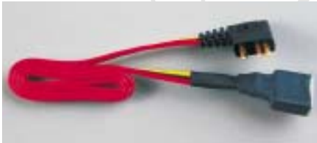
Rallonge mâle femelle, 1 pièce 27 cm réf : 005 8 5047 Rallonge mâle femelle, 1 pièce 60 cm réf : 005 85092 Rallonge mâle femelle, 1 pièce 1,2 m réf : 005 8 5093