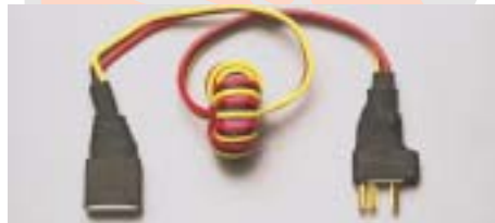
Rallonge antiparasite de 15 cm, 1 pièce. Réf : 005 8 5058