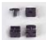
Silentbloks caoutchouc asymétrique. 4 silentbloks et 4 entretoises. Réf : 005 71 5317