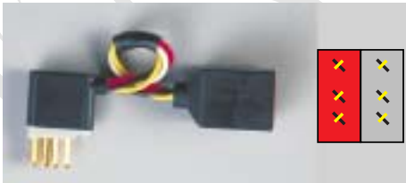
Cordon séparateur de voie, exemple le micro 5/7, 1 pièce Réf : 005 8 5060