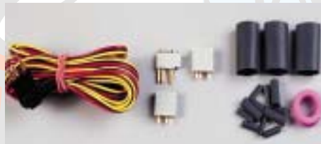
Kit pour réaliser une rallonge antiparasite, 1 pièce. Réf : 005 8 5138