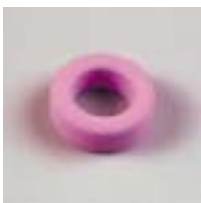
Anneau de ferrite Réf : 1000 2001/6 6 pièces Réf : 1000 2001/12 12 pièces