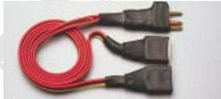
Cordon Y 20 cm, 1 pièce réf : 005 8 5065