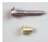
Vis de fixation de servos, 10 pièces. Réf : 004 01 1172 Oeillets en laiton, 10 pièces. Réf : 004 01 1174