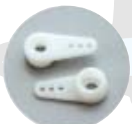
005 8 5205 Palonniers pour Super FL

Palonnier pour servo Slim-Star, non illustré Réf : 005 8 5053 Cordon de branchement (2m) avec prise Micro/nu pour servo Slim-Star Réf : 005 8 5054