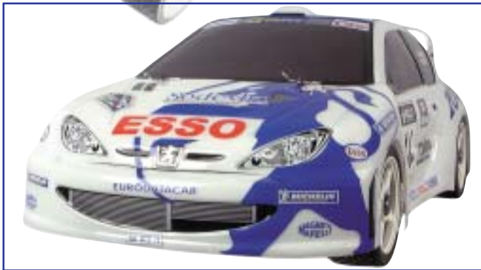
PEUGEOT 206 WRC 4x2 Référence : 013 58 17 2810/XL

Longueur châssis : 530 mm Empattement : 375 mm Poids à vide : 2950 g Voie : 300 mm Garde au sol : 30 mm Puissance moteur : 1,2 cv