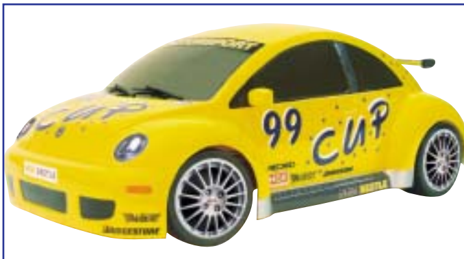
VW Concept 4x2 Référence : 013 58 8317/XL