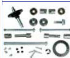
Kit évolutif 4x4 Réf : 013 58 77 0753