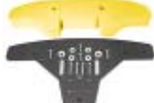
Pare-chocs avec mousse Réf : 013 46 CB 340