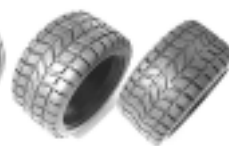
Pneus 013 46 CB 372A,