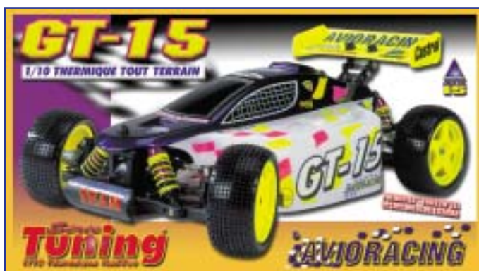
BUGGY GT-15 4x2 Référence : 013 46 1012/L