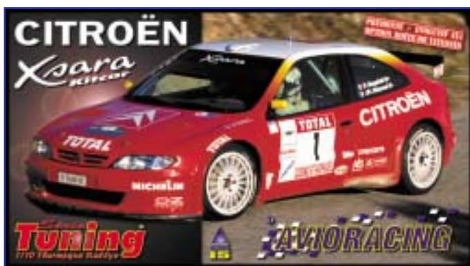
CITROËN XSARA 4x2 Référence : 013 46 1006/L