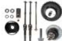
Kit de conversion 4x4 avec boîte de vitesse. Réf : 013 46 CB217