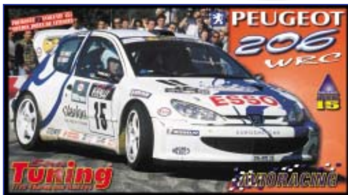
PEUGEOT 206 WRC 4x2 Référence : 013 46 1008/L

12 accus 1,2V 600mA réf : 021 1 600 1 chargeur radiocommande réf : 021 7200 1 tube de colle pour les pneus réf : 013 64 1700 1 bombe de peinture Lexan