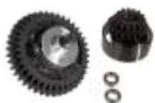
Kit boîte 2 vitesses Réf : 013 46 V2225